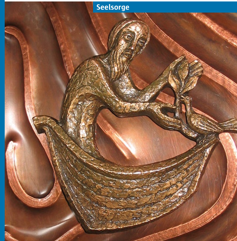
Kapellentür im St. Marien-Krankenhaus

Zeichen der Hoffnung: Am Ende der großen Flut bringt die Taube Noah den Ölzweig